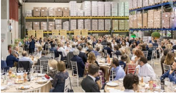
La festa annuale di Banco Alimentare con volontari, aziende e benefattori